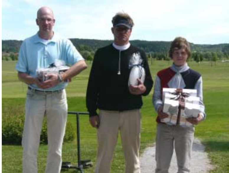
Muurla Design Open, yleinen