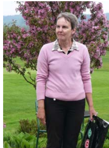
SSP Open PB, naiset