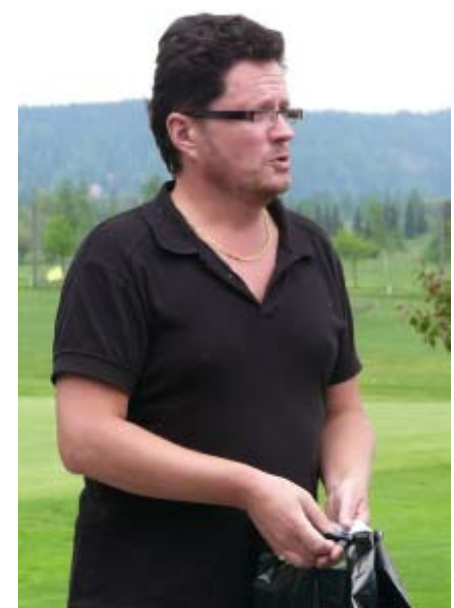
SSP Open PB, miehet