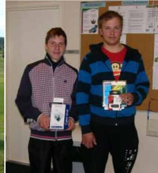
Gigantti Junior Open