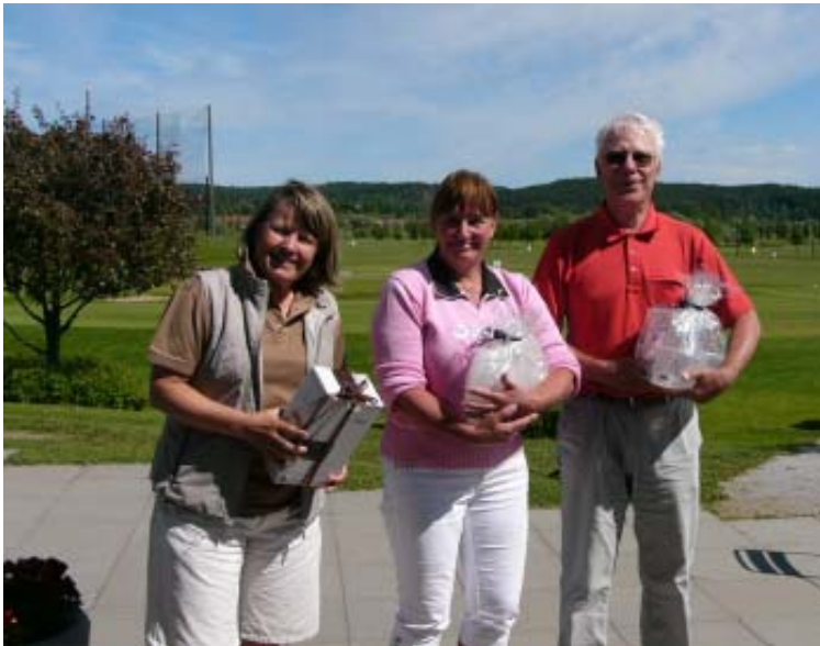
Muurla Design Open, seniorit