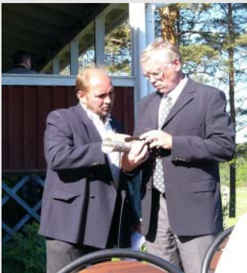
Kapteenit tulosten tarkistuksessa