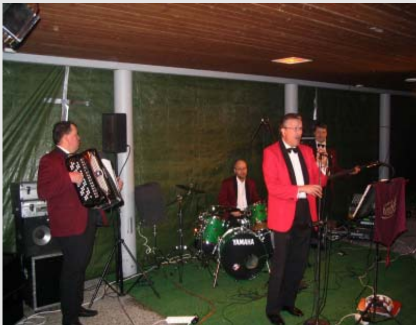
Orkesteri soitti hyvin yhteen, porukkaa riitti puoli kahteen