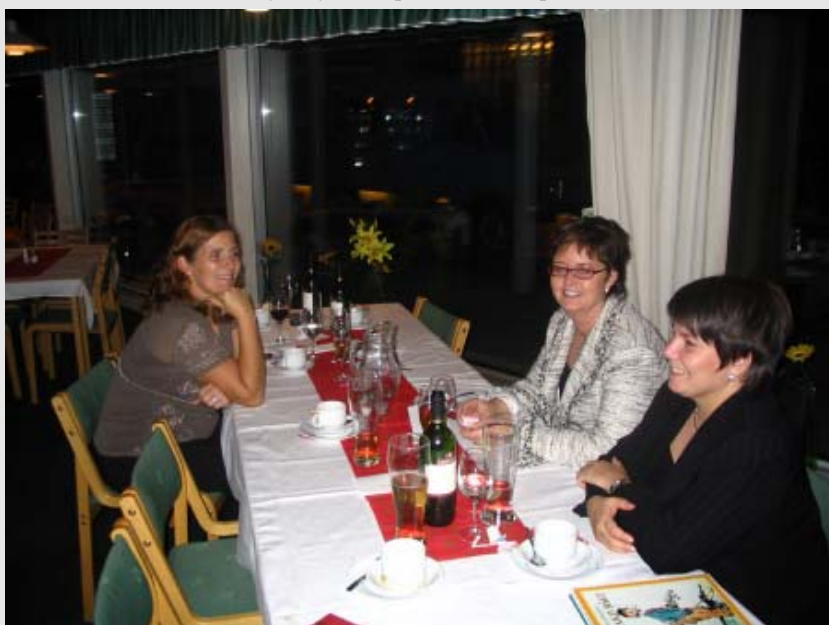
Ei oo Tinan voittanutta, vai pitäisikö sanoa Tinojen