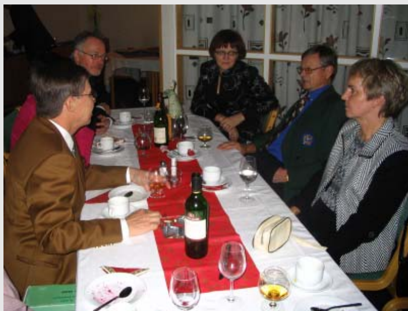
Apen pöydässä riitti vipinää ja taisi keskustelu sivuta golfiakin.