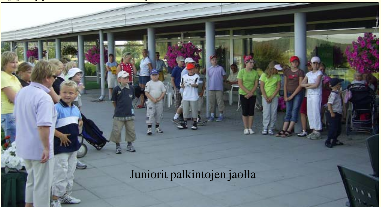
Juniorit palkintojen jaolla