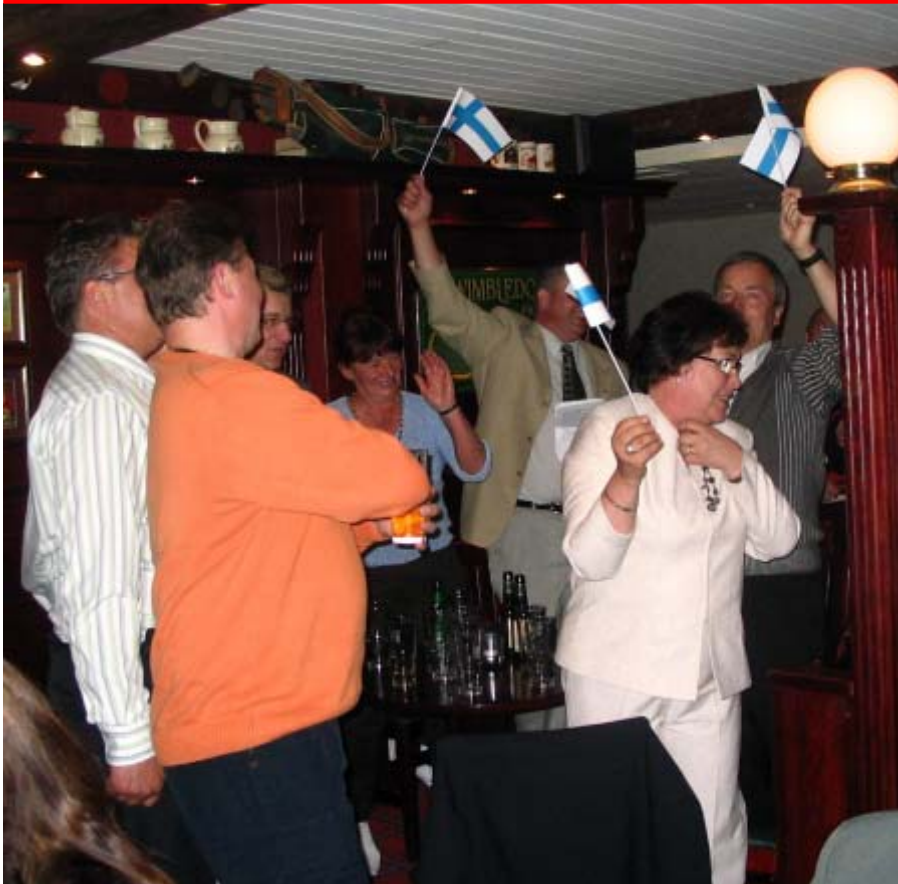
Loordi ja Suomi ovat juuri voittaneet Euroviisut.